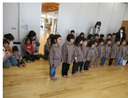
未満児のみんなも