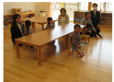
うさぎ組のみんな