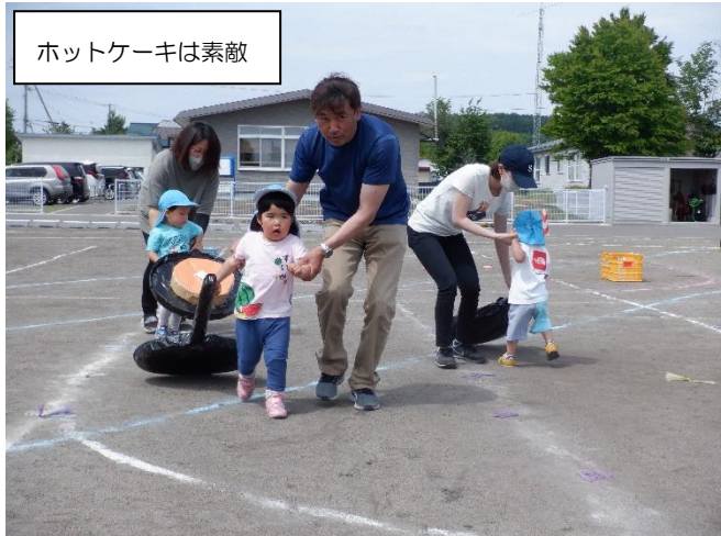
ホットケーキは素敵