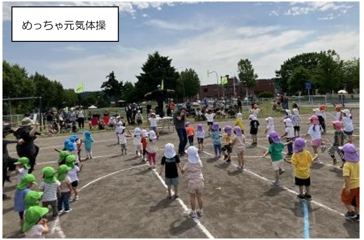
めっちゃ元気体操